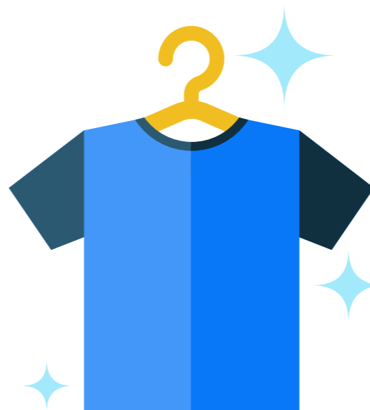
Cámbiate de ropa y lava la que has usado. ¡No olvides limpiar también los zapatos!