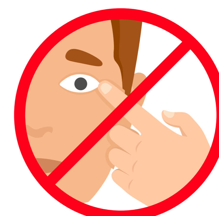
No te toques la cara hasta que tengas las manos bien limpias.