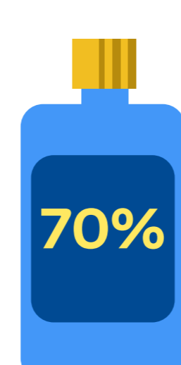
Productos que contengan, al menos, un 70% de alcohol, sin abusar.