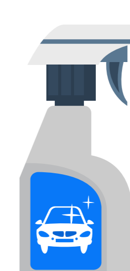
Productos comerciales específicos para limpiar el interior del coche.