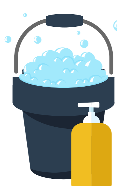
Agua y jabón en cantidades razonables.