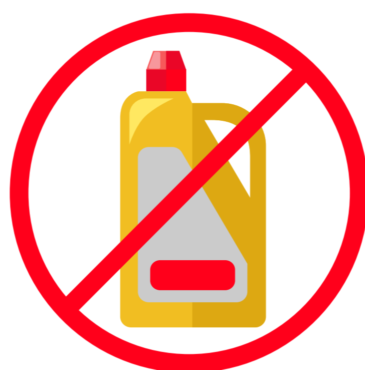
No utilices productos con lejía o agua oxigenada para el interior del coche.