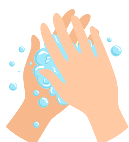
Lávate las manos durante al menos 20 segundos.