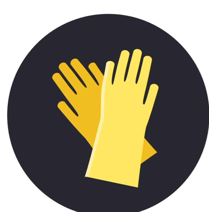
Guantes de látex desechables