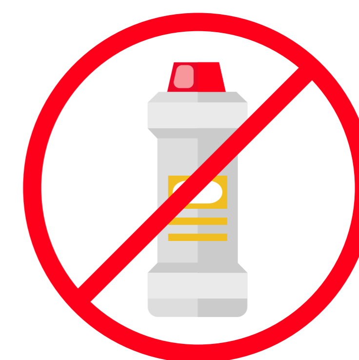
No limpies con amoníaco las pantallas táctiles de tu vehículo.